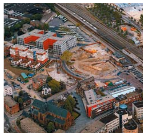
Het Stationsplein in aanbouw.

ontkomen om het proces, de inhoud en de uitvoering integraal te benaderen. Zelfs de contractvorm met de aannemer (UAV-GC, Uniforme Administratieve Voorwaarden voor Geïntegreerde Contractvormen) vraagt om een goed denkproces voordat er maar één streep op een bestekstekening staat. Op basis van het ontwerp van Lodewijk Baljon Landschapsarchitecten is een vraagspecificatie gemaakt. Deze vraagspecificatie moet goedgekeurd worden door de toekomstige beheerders, opdrachtgever, aannemer en de projectleider. Zelf omschrijf ik dat proces als 'vóórdenken', dus niet 'ná-denken'. Bij 'ná-denken' ben je te laat en ga je met een project als dit volledig de mist in.