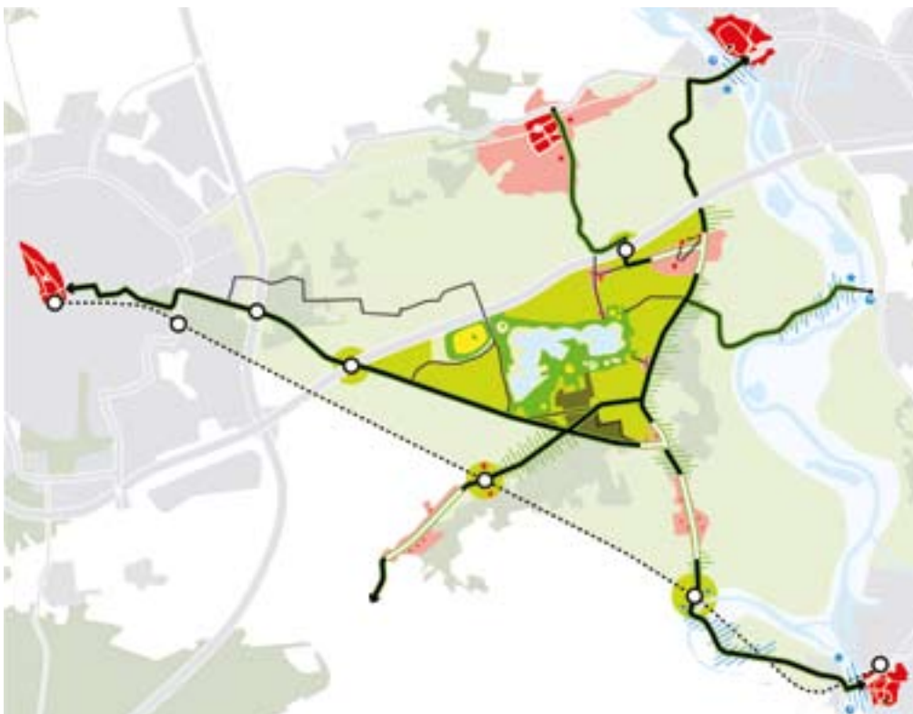
Figuur 3 Stedenbouwkundige uitwerking om recreatiegebied Bussloo uit te bouwen tot 'donororgaan'.

het om zandgebieden gaat. Je moet de stadsrand niet zien als iets wat het omliggende landschap bedreigt en verpest, maar juist als een gebied dat, mits goed ingericht, het omliggende gebied kan ondersteunen en verrijken. We kunnen het ons niet veroorloven om in twee werelden van stad en land te denken, daar hebben we te weinig landschap voor. Met een geleidelijke overgang - ik noem het een zachte zone (zie figuur 1, red.) - schep je bovendien mogelijkheden om het omliggende gebied meer te betrekken bij de stad. Het is daarbij wel belangrijk dat functies als het ware hun gezicht naar buiten richten in plaats van het intern gerichte karakter dat je nu vaak ziet, onder andere bij woonwijken aan de rand van de stad.'