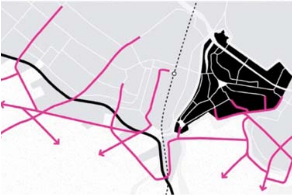
Figuur 2 Schematisch weergave van groene aders.