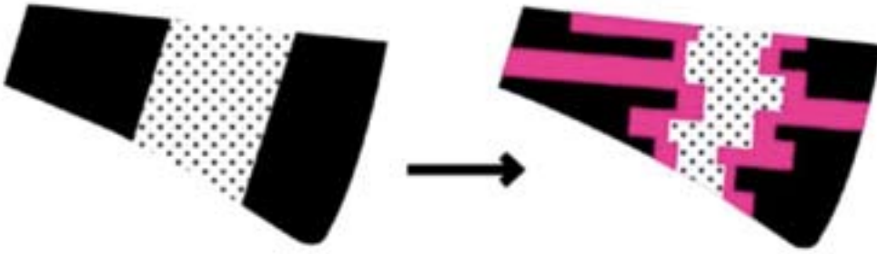
Figuur 1 Schematische weergave van een transformatie van rommelzone naar zachte zone.