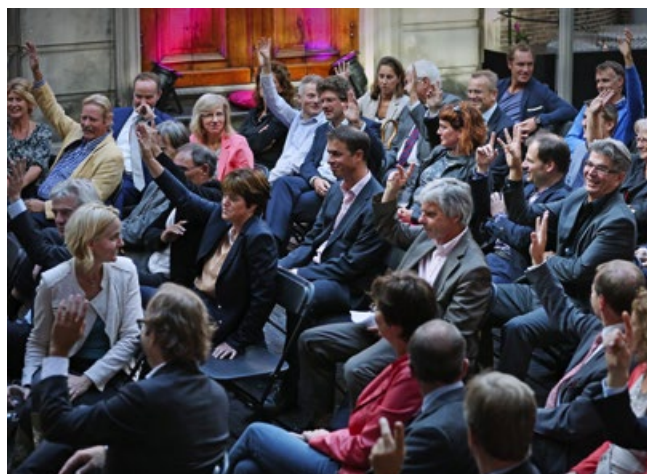
Overzicht zaal algemeen