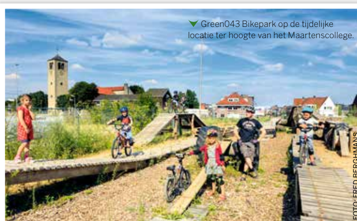
✔ Green043 Bikepark op de tijdelijke locatie ter hoogte van het Maartenscollege.

Sinds 2015 is ter hoogte van het Maartenscollege op het braakliggend terrein langs de voormalige N2 het Green043 Bikepark gevestigd voor crossfietzers. In principe tot eind 2019, maar als het aanslaat en bij de andere plannen past, kan het ook permanent worden op een andere locatie. Verder worden in de plannen allerlei andere doelstellingen meegenomen, zoals duurzaamheid in de breedste zin van het woord. Social Return bij het groenbeheer zit nog in de onderzoeksfase. De Groene Loper is kortom een mooie, vette kluit waar Maastricht nog jarenlang op kan kauwen en die een interessant groen milieu toevoegt, vlakbij het station, en iets verder de Maas en het oude centrum. Een andere barrière vormt het spoor dat in de buurt van het station verrassend weinig passages kent. In een planstudie wordt onderzocht op welke locatie(s) op of onder het spoor verkeersverbindingen gemaakt kunnen worden voor voetgangers en fietsers. Een interessante opgave die de stad weer een stukje 'heler' en veelzijdiger kan maken. ●