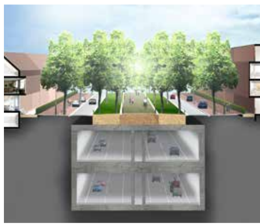
◀ Gestileerde dwarsdoorsnede van de Koning Willem-Alexandertunnel.

Als gevolg van de tunnelbouw werden ongeveer 500 woningen gesloopt. Daar komen er, nadat volgend voorjaar de Groene Loper is voltooid, stapsgewijs 900 voor terug in allerlei typen en prijsklassen. Onder meer chique woningen op een kleine verhoging naar het voorbeeld van de woningen op de statige Hertogsingel. Het bouwprogramma mag maximaal tien jaar in beslag nemen, maar met het oog op de snel verbeterende marktomstandigheden hoopt men dit te verkorten tot zeven jaar. Deze termijn kan weer bijgesteld worden als de situatie daarom vraagt.