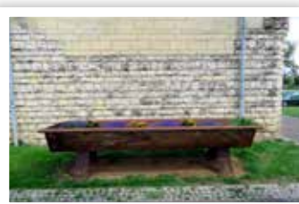
▲ Plantenbak gemaakt van damwanden van de voormalige bouwput.