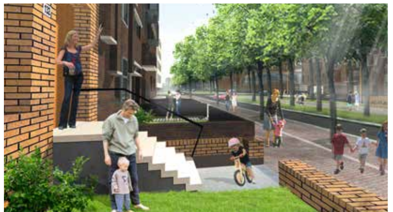
▲ Chique woningen op een kleine verhoging naar het voorbeeld van de woningen op de statige Hertogsingel.