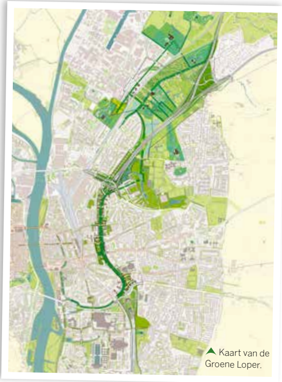
▲ Kaart van de Groene Loper.