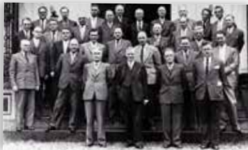
◀ NIDIG-afdeling Friesland, Veenklooster 1957.