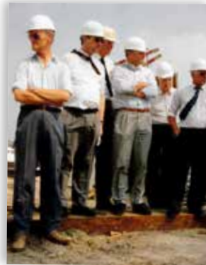
▲ Excursie NIDIG-afdeling Friesland, kring Zuidwest, 1990.