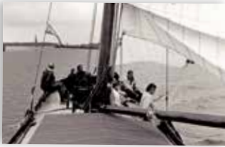
► Interprovinciale Contactdag Groningen, Friesland en Drenthe 1987.