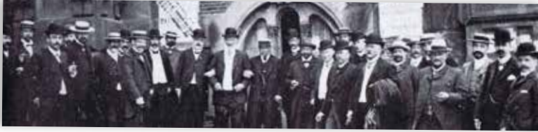
▲ Bijeenkomst van directeuren Gemeentewerken, Amsterdam 1905.