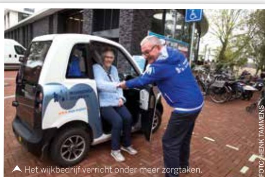
▲ Het wijkbedrijf verricht onder meer zorgtaken.