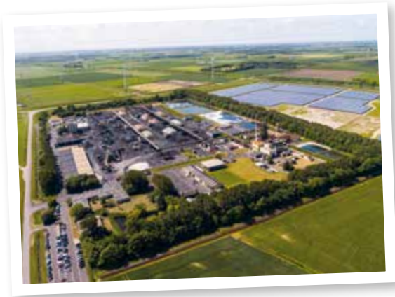
▲ Luchtfoto van het terrein van ESD in Farmsum (bij Delfzijl), een belangrijke veroorzaker van geuroverlast in het gebied.

provincie de goede dingen en doet ze dit goed? Apperlo: 'In dit gebied speelt geurhinder een relatief grote rol. Dat heeft alles te maken met het chemische cluster dat daar zit. Met name één bedrijf, ESD, is verantwoordelijk voor een groot deel van de geuroverlast. We kunnen mede dankzij de monitor goed laten zien hoeveel "geurruimte" er is voor een verantwoord gezondheidsniveau, hoeveel daarvan aan ESD vergund is en wat gedaan zou kunnen worden om het terug te dringen. Met de monitor in de hand kunnen we samen op zoek gaan naar de beste oplossingen. Die hebben bovendien meer draagvlak omdat iedereen kan zien aan welke knoppen we kunnen draaien en wat de afwegingen daarbij zijn.'